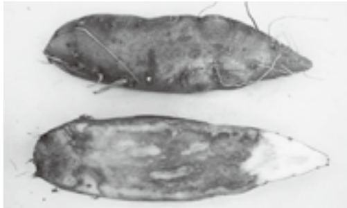
なり首側からの塊根腐敗