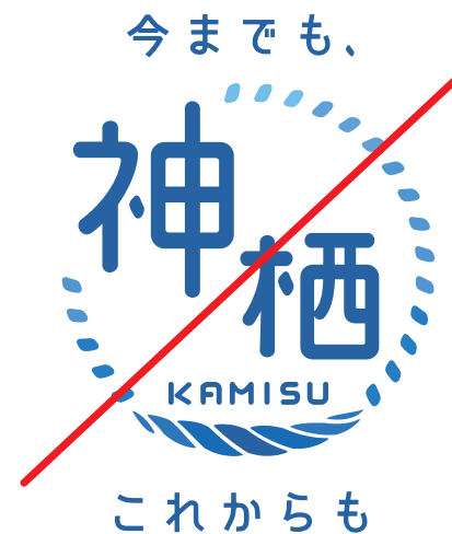
構成要素の バランスを変えない