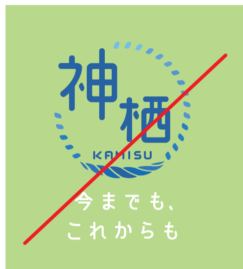
分割してカラーリングしない