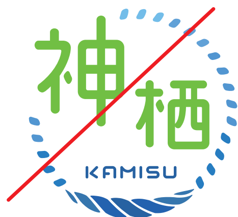
分割してカラーリングしない