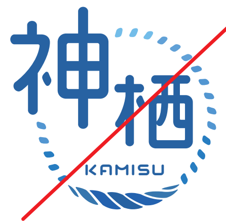
構成要素の バランスを変えない