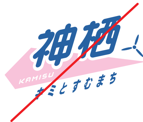
分割してカラーリングしない