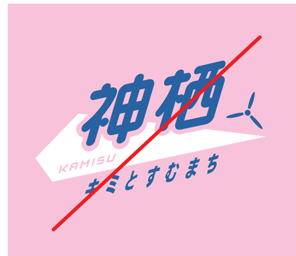
分割してカラーリングしない