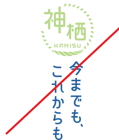
分割してカラーリングしない