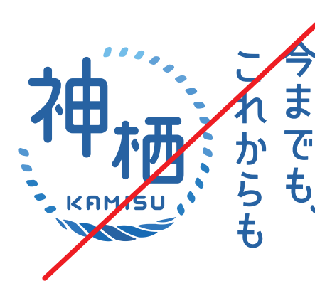
構成要素の バランスを変えない