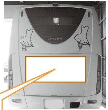
▲市バス背面(イメージ)