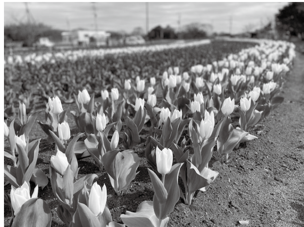
昨年のチューリップの様子

ひろばの様子や日々の活動は、InstagramやTwitterでも配信しています。