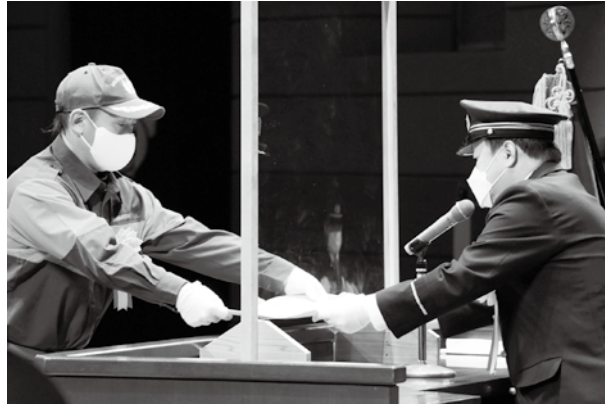
石田市長から表彰状を受け取る消防団員

神栖市消防団には現在906人の団員がおり、市民の安全な暮らしを守るため、昼夜を問わず活動に当たっています。入団を希望する方は、市役所へご連絡を！