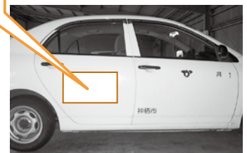
▲公用車側面(イメージ)