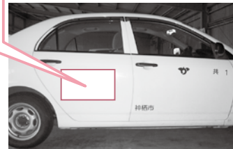
▲公用車側面(イメージ)